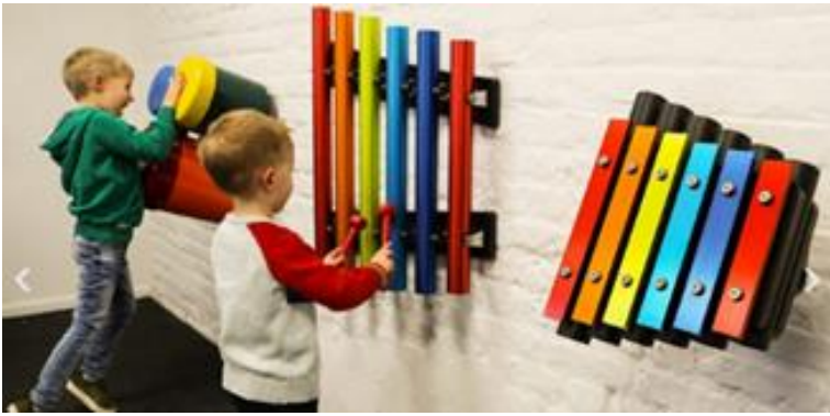
"Ensemble trio arc-en-ciel" : scellement sur mur de la médiathèque, façade ouest, face à l'entrée de l'école de l'horizon