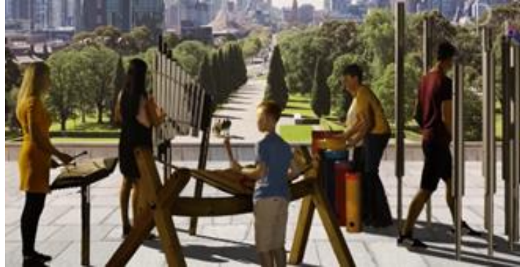
"Ensemble Quintette" : scellement au sol, port de Comberge