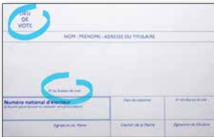
Ci-dessus, vous retrouverez sur votre carte d'électeur votre lieu de vote et le numéro de votre bureau de vote.

de l'Océan. Les autres bureaux se tiendront à la mairie (salle du Conseil, salle des Renardières et/ou Beauséjour). Le numéro de votre bureau de vote sera indiqué sur votre nouvelle carte d'électeur qui comportera également l'adresse du bureau. Vous recevrez votre nouvelle carte à partir de la mi-mai. Enfin, les jeunes ayant fêté leurs 18 ans dans l'année seront invités à une cérémonie citoyenne de remise de leur carte électorale. La date vous en sera communiquée très prochainement.