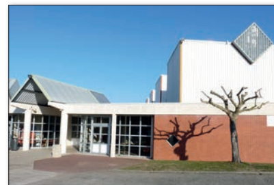
Une réfection importante est prévue pour le Complexe sportif de la Viauderie.