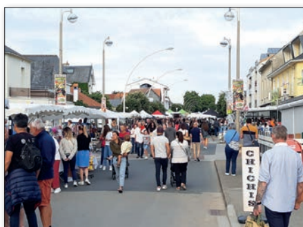
La maisonnette de Noël construite par les services techniques (à gauche) et le marché nocturne de Tharon.