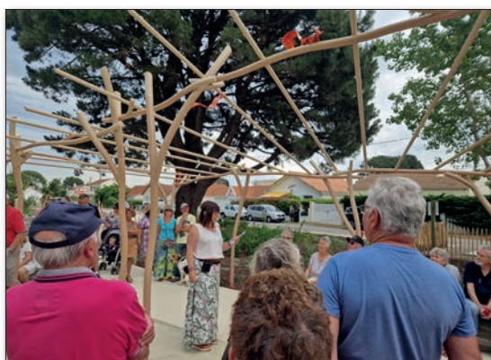
Ci-dessus, l'inauguration du Jardin du Mail le 15 juin 2023.