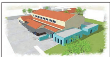
Ci-dessus, images-projets des salles modulables (en haut) et de l'agrandissement du restaurant scolaire (en bas).