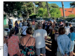
À droite, réunion de concertation pour le réaménagement de la place de la Chapelle. Ci-dessous, esquisse du projet.