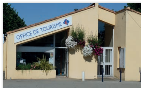
L'Office de tourisme devrait prochainement emménager dans de nouveaux locaux, plus fonctionnels, en entrée de ville.