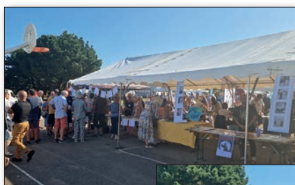
Le Rendez-vous des associations en plein air rassemble les nombreuses associations de la commune et les résidents venus s'informer.