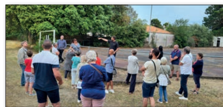
Ci-contre, première réunion de concertation pour le réaménagement de l'espace Comberge. En haut à gauche, la Coulée verte.

En 2021, la loi climat et résilience, couplée à la crise énergétique, a posé d'autres orientations dont nous avons tenu compte dans notre projet politique. En effet, le Zéro Artificialisation Nette (ZAN) à l'horizon 2050 a engagé une réflexion sur l'urbanisation de demain dans notre ville, sans extension d'urbanisation, avec simplement la possibilité de renouveler tout en restant dans l'enveloppe urbaine actuelle, et donc de densifier. De même, la prise de conscience d'une urgence climatique conduira à des travaux d'envergure sur nos bâtiments et éclairages publics afin de diminuer notre empreinte carbone.