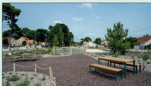
Ci-contre, le jardin du Mail et ci-dessous, le pumptrack.

Aire de fitness, aire de jeux enfants, espaces de convivialité et de détente, voies bleues et vertes au service des piétons et des cyclistes :