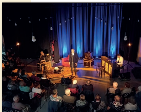
La Troupe Jef interprète Jacques Brel au Canopus.