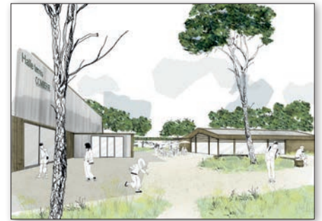
Vue sur l'esplanade (Préau / Campo / Symoé).

ainsi que la gestion de l'eau. Des partis-pris qui s'accordent aux vœux de la collectivité. La procédure d'appel à candidatures pour la maîtrise d'œuvre sera lancée en février.