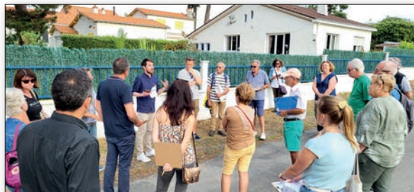
Premier atelier de concertation en juin 2023, le diagnostic en marchant.