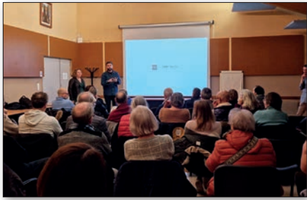
Réunion de restitution, décembre 2023.

particulière a en effet été prêtée au respect du cadre de vie des riverains afin de préserver leur tranquillité, notamment acoustique et visuelle. Qu'il s'agisse du bois d'arbres morts ou issus de l'entretien, de terre, mais aussi de découpes de béton ou d'enrobé