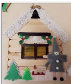
Ci-dessus, réalisation lors de l'Atelier Jeunes de novembre 2023.

→ Conditions d'inscription : 15€, préinscription obligatoire par mail à a.creativeoceane@orange.fr avant envoi de confirmation et règlement par chèque.